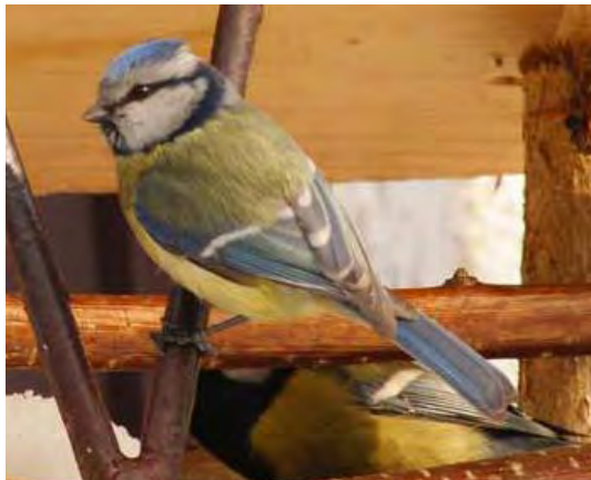
fot. G. Schneider