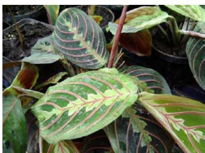
Maranta leuconeura erythrophylla