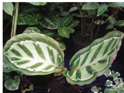
Calathea veitchiana Calathea roseoptica