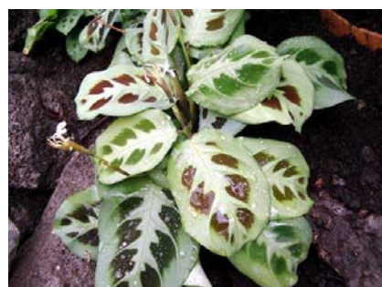
Maranta leuconeura kerchoveana