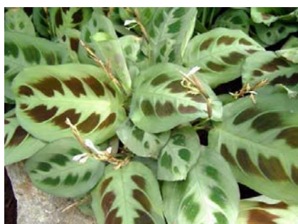
Maranta leuconeura kerchoveana