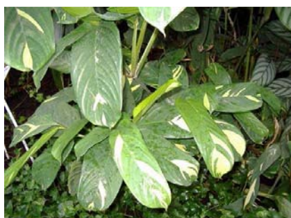
Ctenanthe lubbersiana calathea