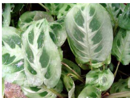
Maranta leuconeura mediovariegata